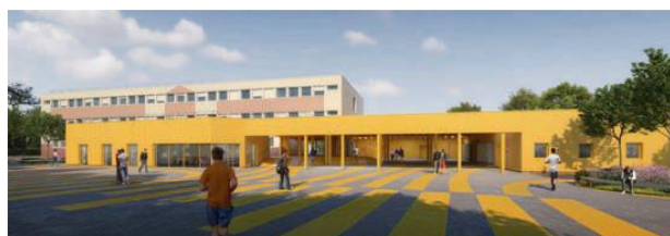
Collège Le Chêne Vert à Bain-de-Bretagne.

D'un montant de 7,7 millions d'euros, l'opération de restructuration du collège Le Chêne Vert à Bain-de-Bretagne sera inaugurée au début de l'année.