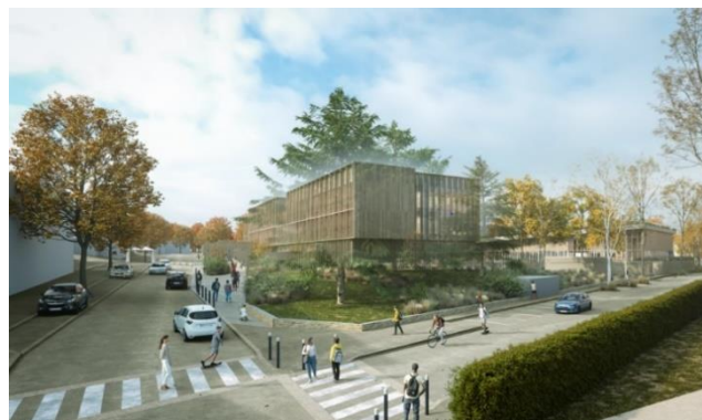
Collège Cleunay à Rennes. ©Atelier des loges - Rennes

Les travaux débuteront dans le courant de l'année et permettront d'améliorer les performances énergétiques des bâtiments, d'inscrire le projet dans son environnement urbain et paysager et d'offrir de meilleures conditions de travail et d'apprentissage aux élèves.