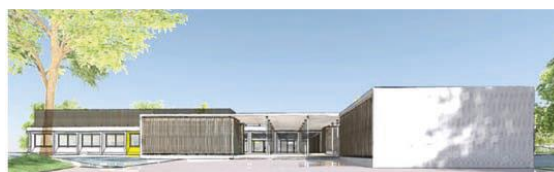
Collège Georges-Brassens au Rheu. © Agence Archipôle

Débutés à la fin de l'année 2022, les travaux de restructuration du collège Georges Brassens au Rheu se termineront dans le courant de l'année 2025 pour un montant de 13,4 millions d'euros intégralement financés par le Département d'Ille-et-Vilaine.