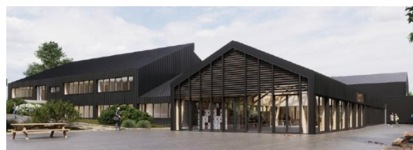
Collège du Querpon à Val-d'Anast © ANTHRACITE Architecture – Rennes

Ils permettront de réaliser des économies d'énergie et d'améliorer le fonctionnement global du collège par une restructuration des espaces, notamment les zones enseignement et demi-pension, pour un montant total de 12,17 millions d'euros.