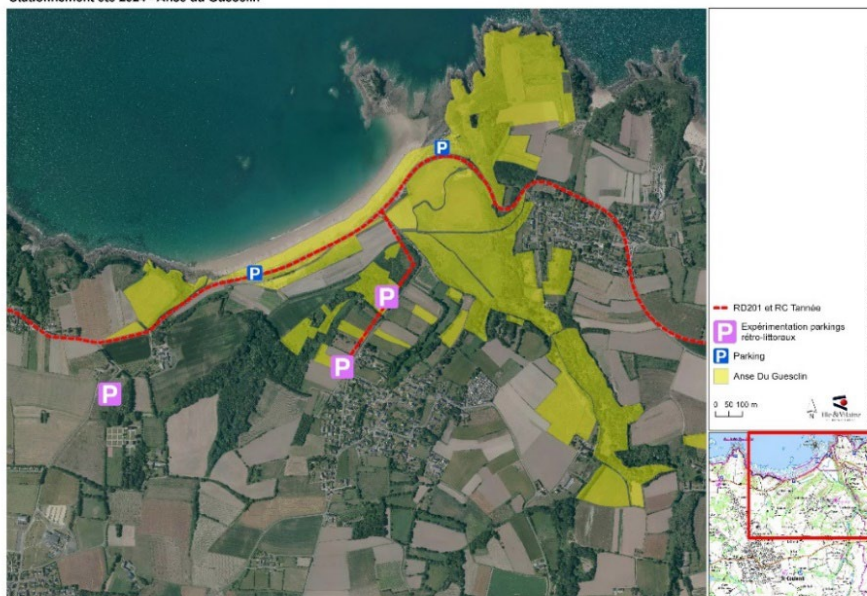
Stationnement été 2024 - Anse du Guesclin