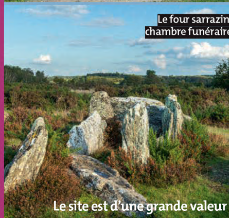
Le four sarrazin, chambre funéraire