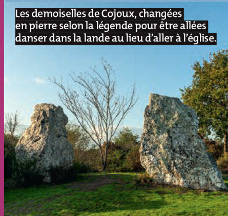
Les demoiselles de Cojoux, changées en pierre selon la légende pour être allées danser dans la lande au lieu d'aller à l'église.