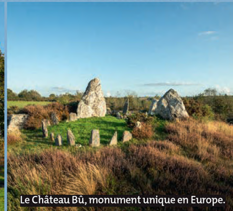
Le Château Bû, monument unique en Europe.