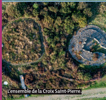
L'ensemble de la Croix Saint-Pierre.