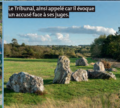
Le Tribunal, ainsi appelé car il évoque un accusé face à ses juges.