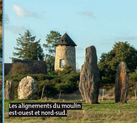
Les alignements du moulin est-ouest et nord-sud.