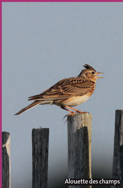
Alouette des champs