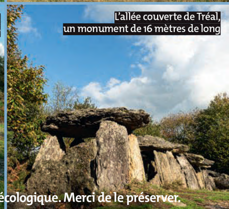
L'allée couverte de Tréal, un monument de 16 mètres de long

Le site est d'une grande valeur écologique. Merci de le préserver.