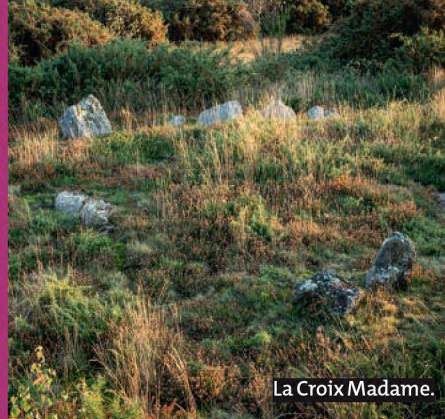
La Croix Madame.

Beaucoup d'oiseaux du site sont protégés : fauvette pitchou, tarier pâtre, engoulevent d'Europe, linotte mélodieuse et huppe fasciée. L'hélianthe en ombelle, arbrisseau à fleurs blanches, est rare en Ille-et-Vilaine.