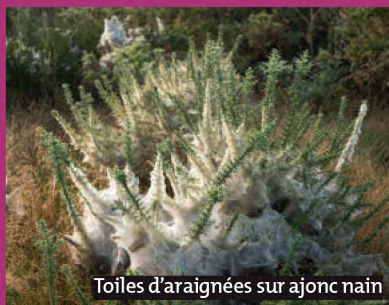
Toiles d'araignées sur ajonc nain