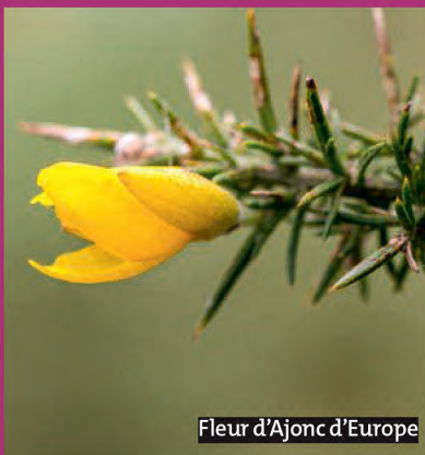
Fleur d'Ajonc d'Europe

Les bruyères cendrées, les ajoncs d'Europe et les orpins des Anglais habillent le schiste pourpre des coteaux du Boël. De petits boisements de pins et de chênes pédonculés complètent le paysage.